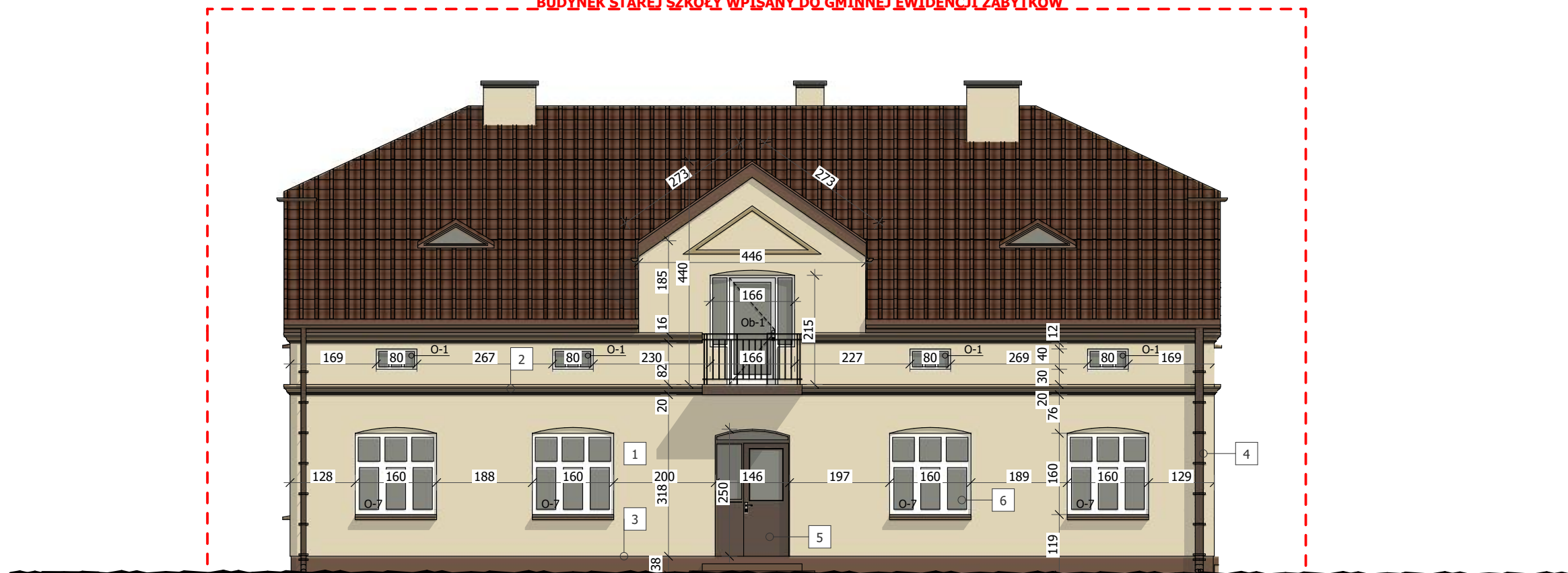
ELEWACJA ZACHODNIA - E1

BUDYNEK STAREJ SZKOŁY WPISANY DO GMINNEJ EWIDENCJI ZABYTKÓW